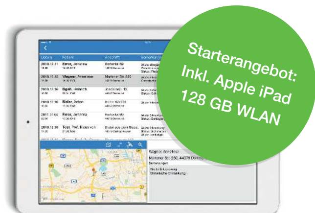
Mobil unterwegs mit der iPad-Schnittstelle iQvisit

Stellen Sie um, und stellen Sie sich ein auf einen optimierten Praxisalltag. Ob Abrechnung, Dokumentation, Arztbriefe, Termine: mit QUINCY dokumentieren Sie alle medizinisch relevanten Daten einfach, schnell und effizient. Und Sie behalten jederzeit den Überblick. Auch unterwegs sind Sie mit der mobilen Lösung iQvisit und dem Apple iPad jederzeit einsatzbereit. Dabei übernimmt unsere Software die Daten problemlos aus Ihrem bisherigen System. Machen Sie sich die Theorie in Ihrer Praxis einfach leichter – Mit QUINCY.